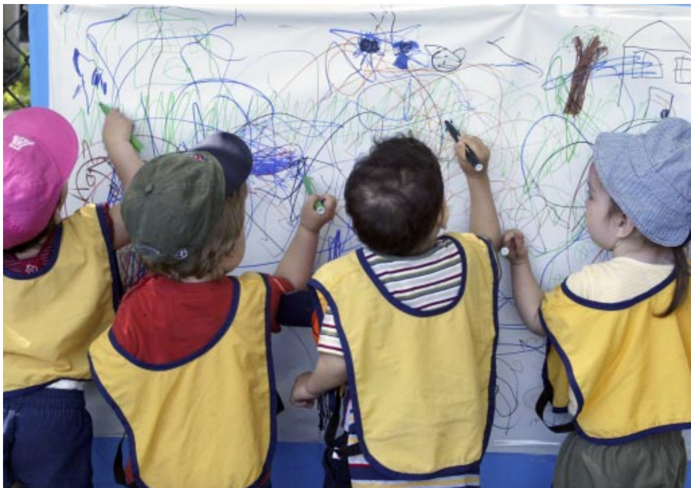
The Gazette, Montréal

La garde non-parentale est aujourd'hui la norme pour la majorité des enfants d'âge préscolaire au Canada, note Jane Jenson, mais seulement le quart d'entre eux fréquentent un service de garde réglementé.