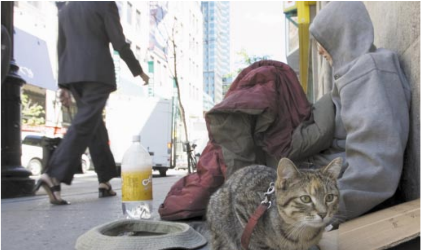
The Gazette, Montréal

Le nombre grandissant des sans-abri est l'un des indicateurs les plus visibles de la croissance des inégalités au pays écrit Lars Osberg : « Tout comme les graffitis et les carreaux brisés dénotent un quartier négligé, la situation des sans-abri témoigne de façon on ne peut plus visible d'une négligence sociale à l'endroit des plus démunis. »